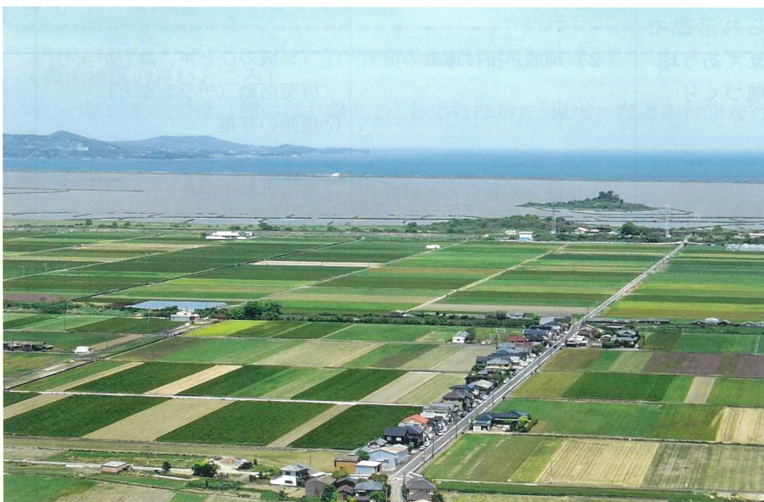
五穀岳から有明海を望む