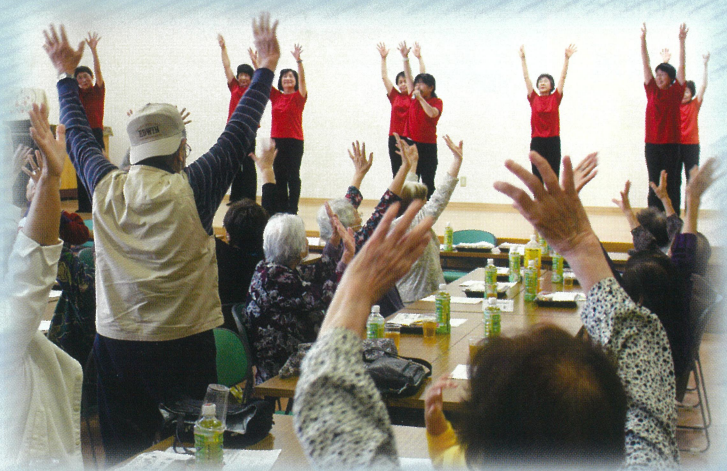
ひとり暮らし高齢者の集い