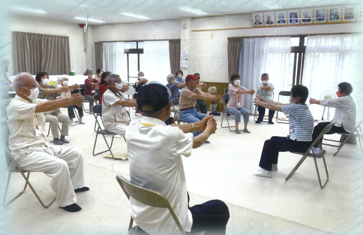
ふれあい いきいきサロン