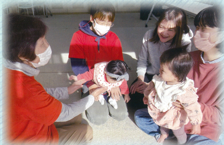
子育てサロン（おひさまくらぶ）