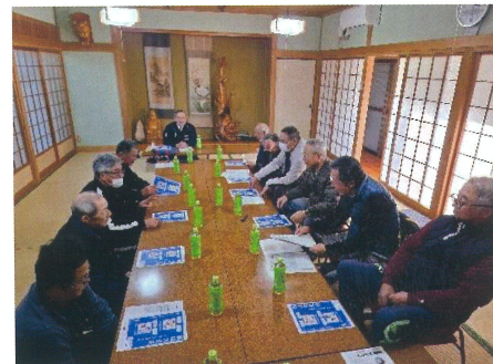
喜集会 諫早警察署の特殊詐欺防止講話