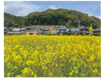
田尻 平石の菜の花畑