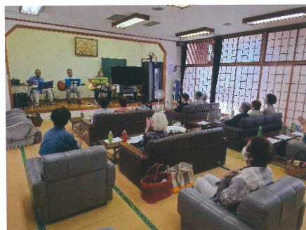
な釜会・さくら会合同ミニ敬老会