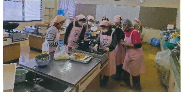
「美味しいお弁当を届けたい」

森山地区では、75歳以上の高齢者は976人（令和7年1月1日現在）、そのうち167人がひとり暮らしです。令和6年度高齢者白書によると65歳以上のひとり暮らし高齢者は令和32年には男性は4人に1人、女性は3人に1人になると予測されています。