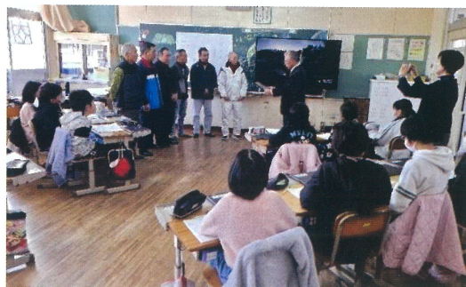
表彰式と研究発表会

市立森山東小学校の「田んぼの先生」が諫早医師会保健文化賞を授与されました。「田んぼの先生」とは、同校区で稲作や畑作をされている農家の有志で、20 年以上前から森山東小学校の児童に机上ではできない農作業の体験学習を指導しています。小学 5 年生には、「田植えから稲刈り、もちつきまで」、小学 1 年生、2 年生には「芋の芽さしから芋ほりまで」、孫のような児童と交流しながら活動しています。