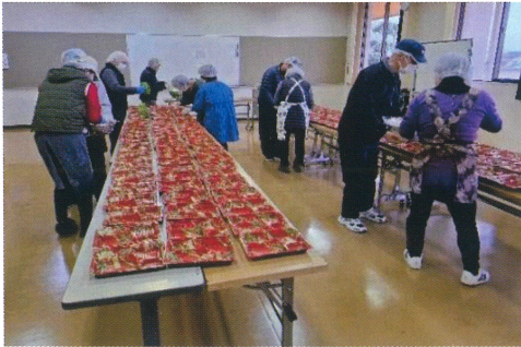
「昼食に間に合わせよう」

森山地区食生活改善協議会の皆さんは、前日から食材調達・仕込みを行い、当日は手際よく調理作業を進めました。民生委員・児童委員の皆さんは、調理されたメニューの配膳作業。会場では、慣れない作業に笑いが絶えず、「気持ちが届けば嬉しいね」との声もあり、各地区別に仕上げて配達に出発しました。「森山のお弁当」は、地元食材を中心にした豊富なメニューでボリュームがあると人気です。