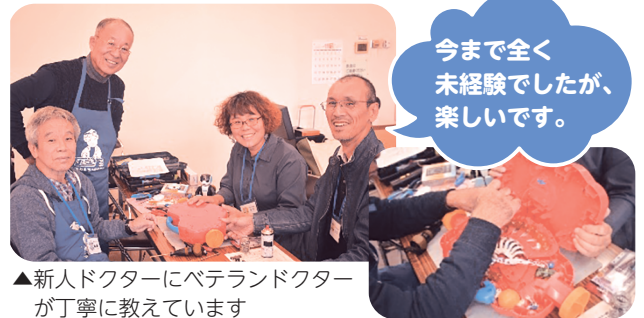
▲新人ドクターにベテランドクターが丁寧に教えています

「おもちゃが動かなくなっって…」おもちゃ病院には治療の依頼が年間400件ほど寄せられます。おもちゃの中には、複雑な配線や電子部品がたくさん。治療はまさに職人技です。家電修理が得意だった人も多く、自分の技術で大切なおもちゃを復活させ、喜んでもらえることに大きなやりがいを感じています。依頼者の笑顔が何よりの励みであり、ドクター同士が知恵を出し合いながら協力する時間も、活動の楽しみとなっています。