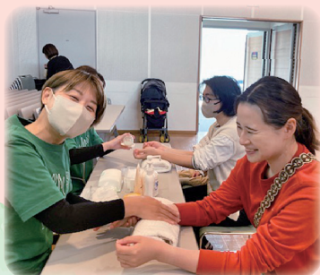
ハンドマッサージ