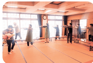
▲ボランティアも一緒に体操をしています

その中の一人は「父親の世話をしているので、勉強になる。みんなと楽しく会話しながら自分自身も元気をもらっている」と、地域住民同士のふれあいを楽しんでいます。