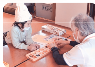
昨年度の様子（レクリエーション体験）