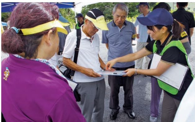
ボランティア活動の内容を伝えています