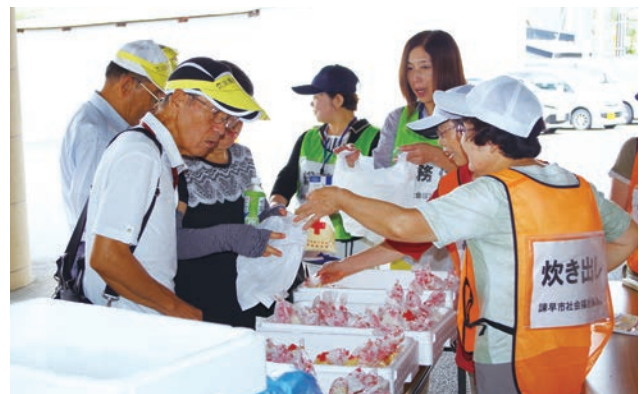
ハイゼックス袋を使った炊き出しの様子

10月1日(土)、諫早市社会福祉協議会は、諫早市新道町駐車場で「災害ボランティアセンター設置運営訓練」を実施しました。