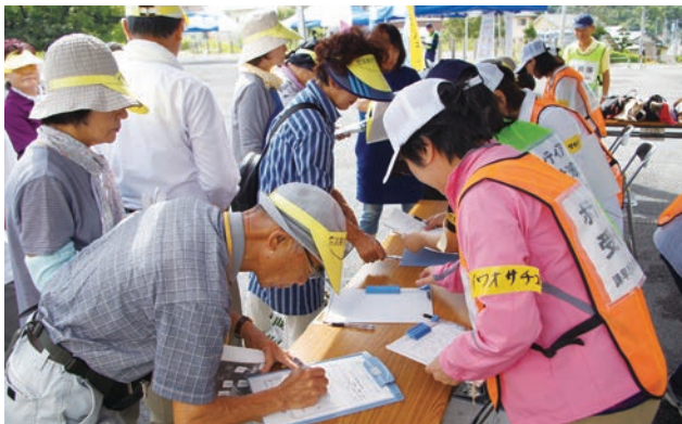
ボランティア受付の様子