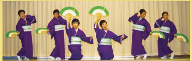
昨年の演芸大会の様子 豊寿会 新舞踊「浪花川」

観覧料は、すべて歳末たすけあい募金へ寄付いたします。皆さまのご来場をお待ちしております。