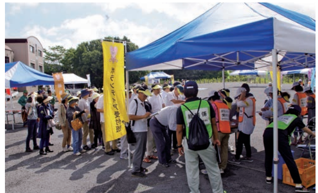
多数の参加をいただきました