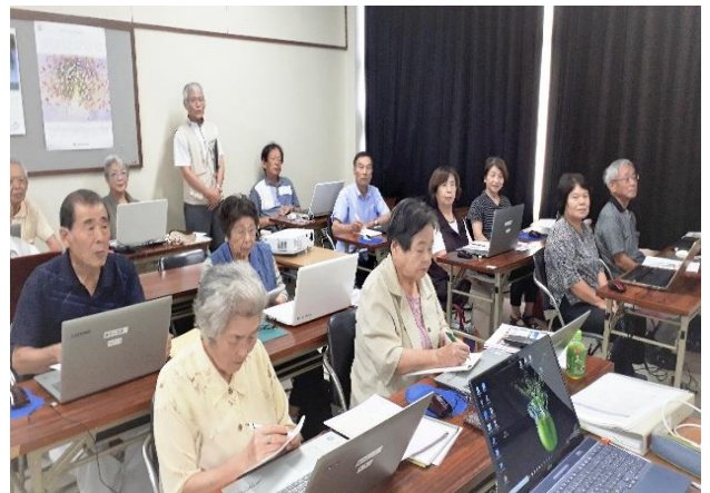
ついて行こうデジタル社会に