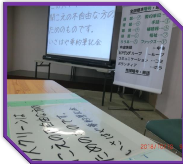
機材による全体表