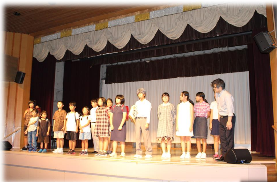
「第11回 諫早大水害を語り継ぐ ～7月25日を忘れない～」