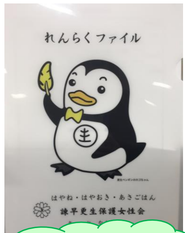
更生ペンギンの ホゴちゃん