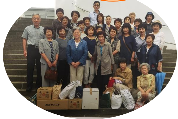
更生保護施設慰問