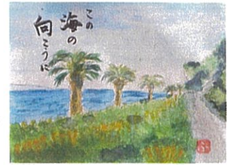
山本二美枝さん作品