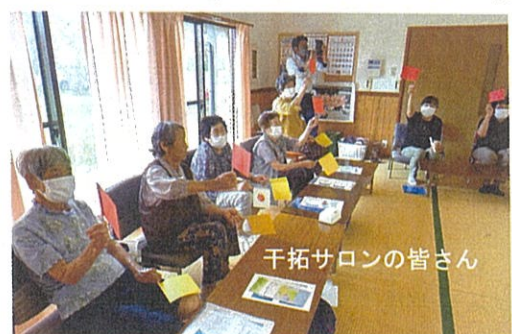
干拓サロンの皆さん