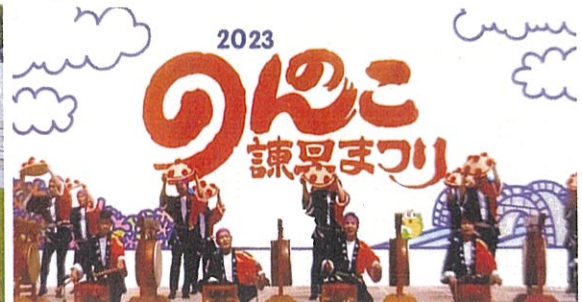
祝太鼓と花笠音頭の共演