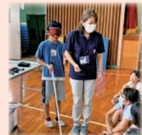
小中学生等へ福祉体験学習の実施