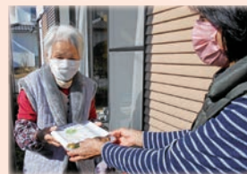
一人暮らし高齢者等へふれあい食事サービスの実施(地域住民の見守り活動)