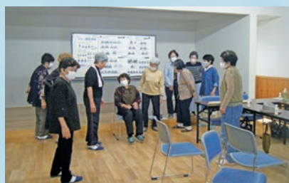
ふれあいいいききサロン (新道町)