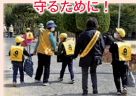
小学一年生へ黄色い帽子配布