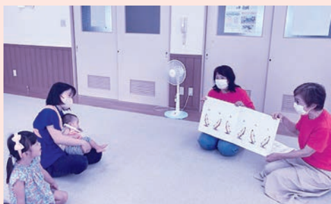
子育てサロン「おひさまくらぶ」

市内では、19 箇所子育てサロンが開催。その活動費の一部に赤い羽根共同募金を活用し、絵本や折り紙を購入するなど、親子が楽しく過ごせるような工夫をしています。