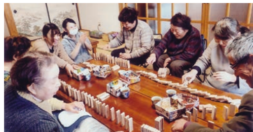
サロンではみんなの笑顔が溢れています

「コロナ禍で地区社協の事業は思うように実施できていないが、昨年からの取り組みでいる地区社協活動計画に基づいて、長田地区の強みである地域のボランティアをはじめ、各関係機関と連携しながら計画を実行していきたい」と今後の抱負を語られました。