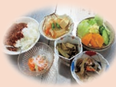
子どもが喜ぶ 子ども食堂の食事に