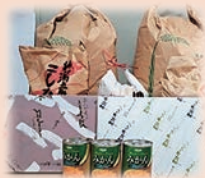
社協に届いた食品 (お米・缶詰・そうめん等)