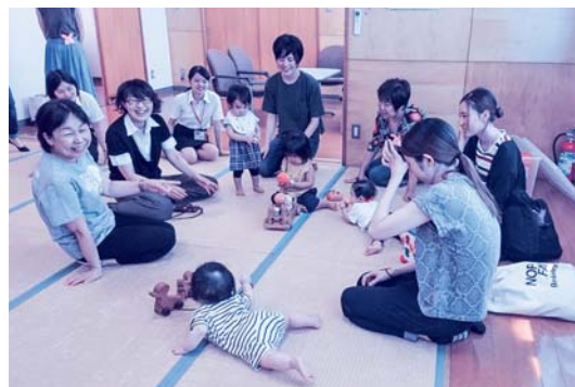
自然とみんなの笑みがこぼれます

皆さんの地域で開催されているサロンは以下のとおりです。子育てサロンに関する問い合わせがありましたら以下まで気軽にお尋ね下さい。