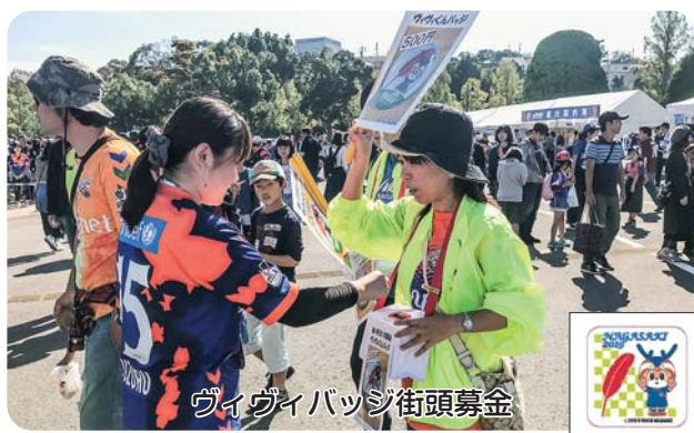
ヴィヴィバッジ街頭募金