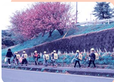
黄色い帽子贈呈事業