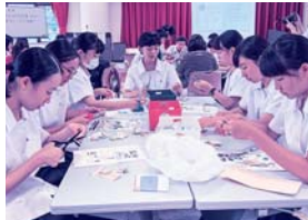
使用済み切手整理ボランティアの様子

この団体を通じて、切手収集家に換 金してもらい、換金されたお金はアジ ア・アフリカの医療従事者をめざす現 地の人々のために使用される貴重な資 金となっております。