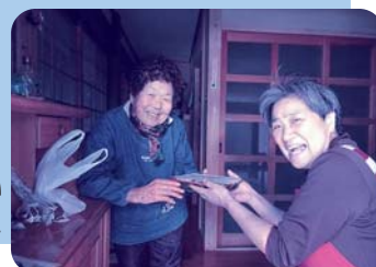
ふれあい食事サービス

米寿記念写真 510人 (在宅者 387人) (施設入所者 123人) ひとり暮らし高齢者の集い 694人 ふれあい食事サービス 2,084人