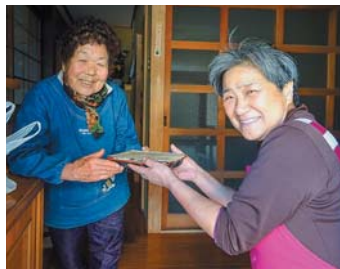
ふれあい食事サービス

市民ぐるみで集められた共同募金の配分金を活用し、福祉のまちづくりに向けて、地域に対応した住民の地域福祉活動や福祉団体等の支援及び助成を行います。