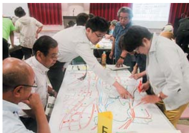
災害ボランティア講座

また、講座・研修会を企画し、ボランティア活動に取り組みやすい環境を整備するとともに、身近な地域でボランティア活動が展開されるよう支援します。