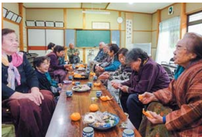
ふれあいいいききサロン

市内全域に組織された住民の自主的な組織である20地区(校区)社協との連携を密にし、住民同士で解決していこうとする住民の支え合い活動を支援し、地域の福祉力を高めます。