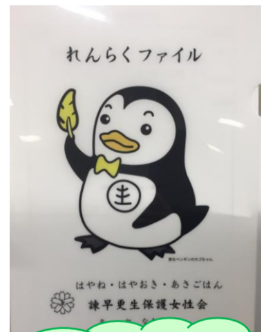
更生ペンギンの ホゴちゃん