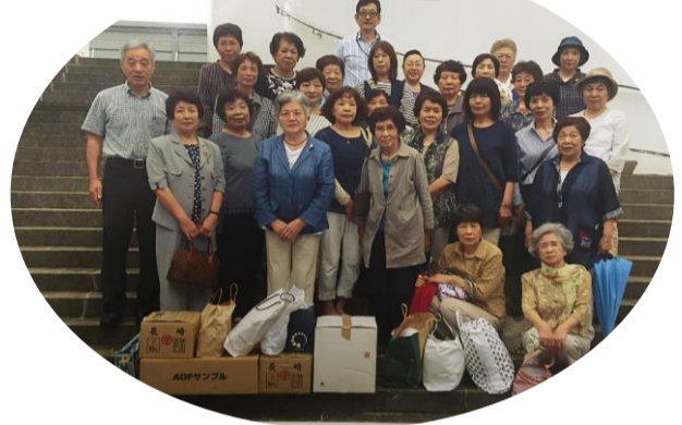
更生保護施設慰問