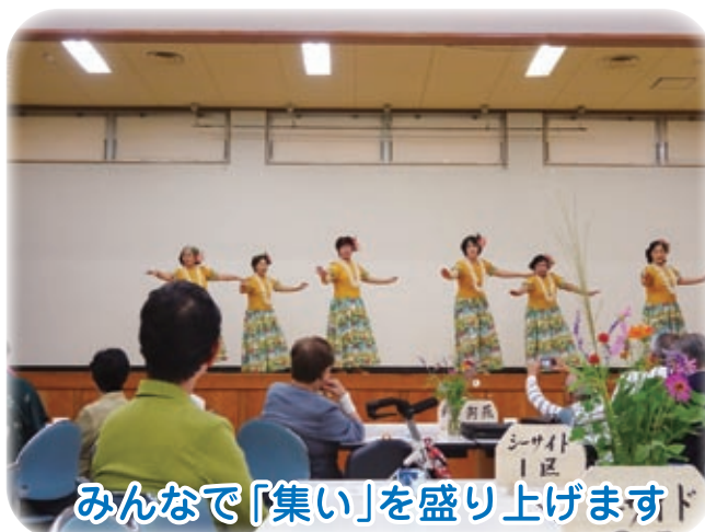
みんなで「集い」を盛り上げます