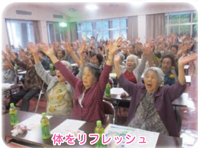
体をリフレッシュ