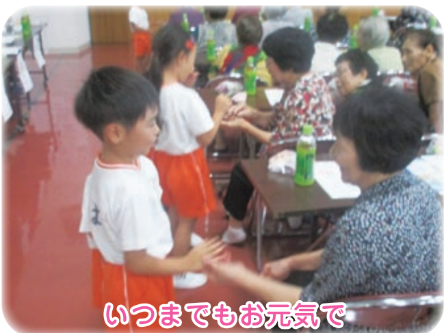
いつまでもお元気で