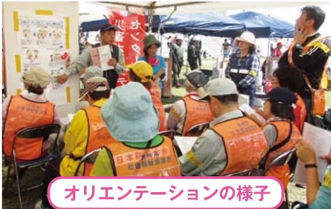
オリエンテーションの様子