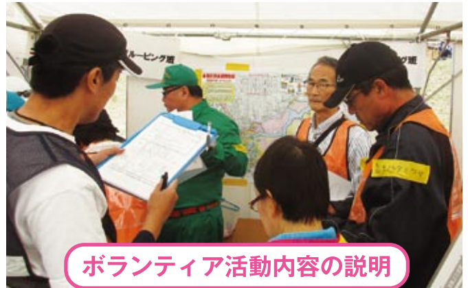
ボランティア活動内容の説明