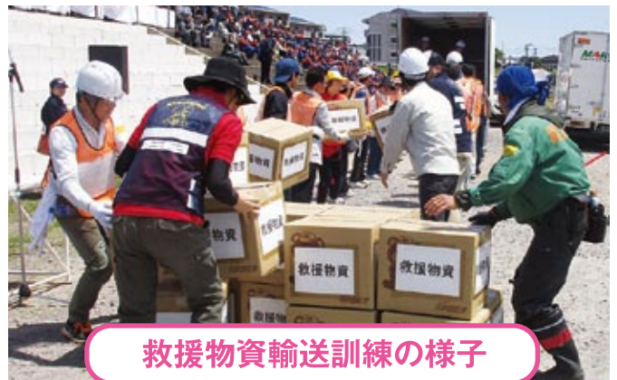
救援物資輸送訓練の様子