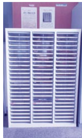
ボランティア連絡協議会登録団体メールボックス

イベントの紹介や協力依頼などのチラシ配付、各団体同士の連絡など、自由にご活用ください。(利用料は無料)