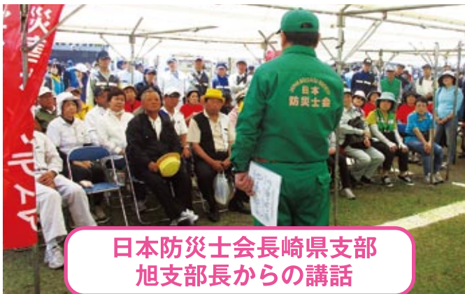
日本防災士会長崎県支部 旭支部長からの講話