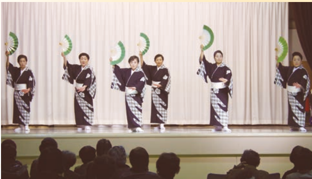
昨年の演芸大会の様子 豊寿会 新舞踊「男道」

歳末たすけあい募金運動の一環として、チャリティーの演芸大会を開催します。観覧料は、すべて歳末たすけあい募金へ寄付いたします。皆さまのご来場をお待ちしております。