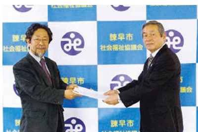
中野地域福祉活動計画策定委員長から本会会長への報告

地域が抱える様々な福祉課題に対して、地域の皆さんや関係機関・団体と連携・協働を深め取り組み、誰もが安心して生活できる地域づくりを進めてまいります。