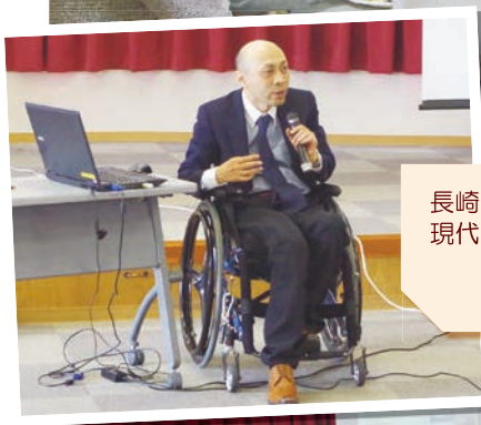
長崎ウエスレヤン大学 現代社会学部 社会福祉学科