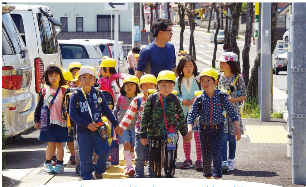
北諫早小学校1年生の下校の様子