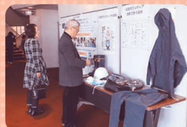
▲災害ボランティア養成講座の パネル展示を行いました