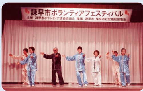
太極拳（筒化24式）の見事な演舞