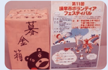
▲熊本地震被災地への募金協力ありがとうございました

また、ボランティア団体の活動を紹介する展示パネルが設置され、参加者の方々は見入っていました。最後に、参加者全員で手話ソングを歌うなど、参加者たちは交流を深め、ボランティアの輪が広がりました。