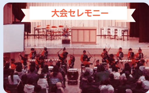
▲サンタの家保育園による和太鼓演奏