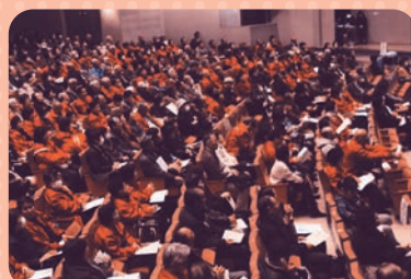
▲大勢の来場者で賑わいました