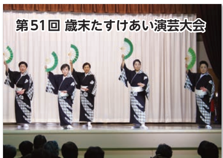
第51回 歳末たすけあい演芸大会