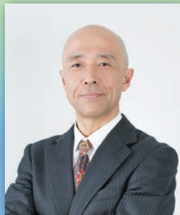
弁護士 菊地 幸夫 氏 日本テレビ 「行列のできる法律相談所」に レギュラー出演中!