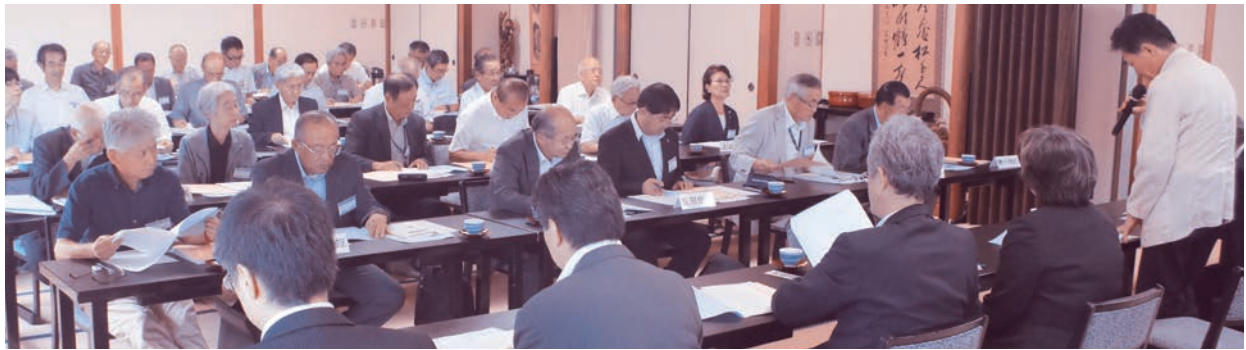
諫早市地区社協会長会 神崎代表（有喜地区会長）挨拶