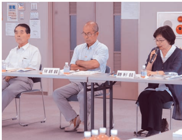
第1回策定委員会の様子