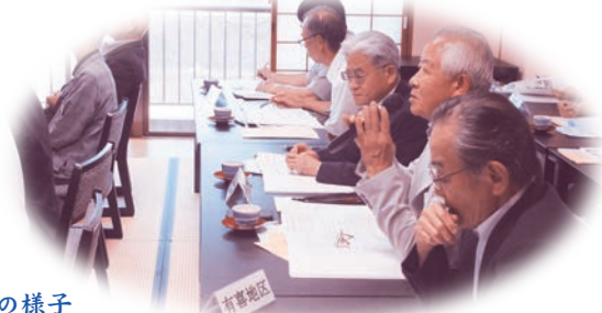
活発な意見交換の様子

7月15日、平成28年度第1回諫早市地区社協会長会会議が開催され、諫早市内の20の各地区（校区）社協会長・事務局長、諫早市役所、諫早市社協、総勢55名が一堂に会しました。