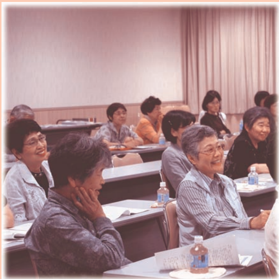
～諫早市ボランティア連絡協議会総会の様子～

諫早市ボランティア連絡協議会は、市内のボランティア活動をより円滑に推進するために、会員がお互いに連携・交流・研修し、意識や意欲を高め、継続的な参加を促すことを目的として結成されています。