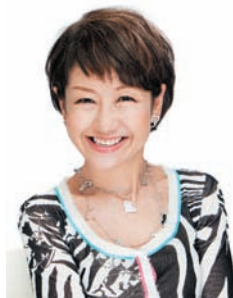
ジャズシンガー 綾戸 智恵 氏