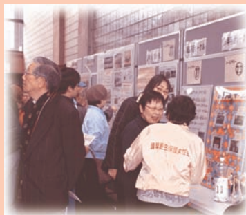
～ボランティアフェスティバルの様子～