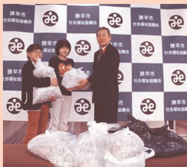
小栗小学校育友会