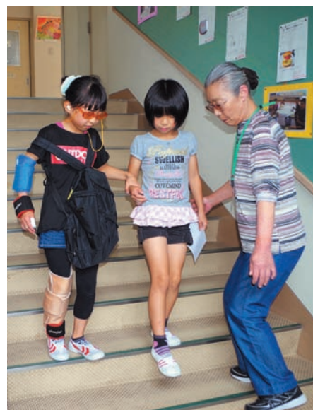
高齢者疑似体験(伊木力小学校)

諫早市社会福祉協議会は、地域、学校、職場に福祉体験サポーターを派遣し、福祉体験学習の支援を行っています。