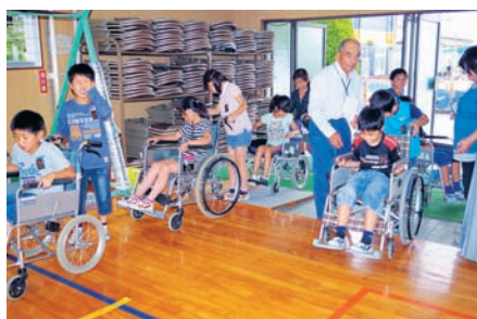
車いす体験(北諫早小学校)