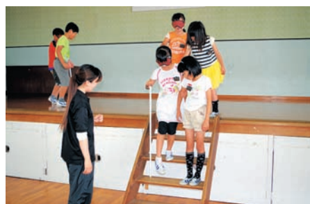
視覚障害者疑似体験(西諫早小学校)