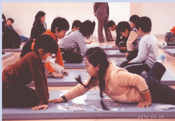
平成27年2月28日(土)第5回ふるさと諫早かるた大会

枚1枚が諫早に生きることの喜びにつながることをいつも念じて、私たちはボランティア活動にいそしんでいます。